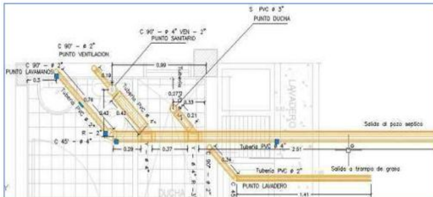
Diagrama de red sanitaria para unidad Sanitaria

Las aguas residuales generadas en los baños serán conducidas a un sistema de tuberías y registros que se conectará al sistema de tratamiento en el sitio de origen. Para todo el sistema se usarán tuberías PVC SANITARIA, debido a su buen comportamiento ante las aguas residuales y facilidad de instalación. Los colectores se localizan al lado de los baños y se tendrán las distancias mínimas a otras redes según lo estipulado en el RAS 2017. La distancia a otras redes, en especial a la red de acueducto, será de 1,5 m en la dirección horizontal y 0,3 m en la dirección vertical medido de cota clave de alcantarillado a cota bateado la tubería de otros servicios. Las conexiones domiciliarias y los colectores de aguas residuales deben localizarse por debajo de las tuberías de acueducto. La velocidad máxima no excederá a 5 m/s. La velocidad mínima real será de 0.6 m/s (RAS). Se establece el Esfuerzo Cortante Medio (Fuerza Tractiva) en un valor mínimo de 0.15 kg/m 2 . En aquellos casos en los cuales, por las condiciones topográficas presentes, no sea posible alcanzar la velocidad mínima, se verifica que el esfuerzo cortante sea mayor que 0,12 kg/m 2 . La pendiente mínima estará determinada por la velocidad mínima y la pendiente máxima como la pendiente necesaria para la velocidad máxima.